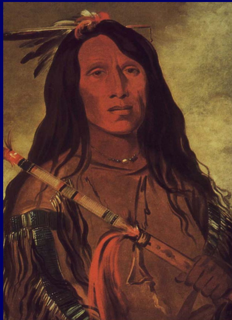
Nee-hu-o-ee-woo-tis Il Lupo e la Collina, capo cheyenne