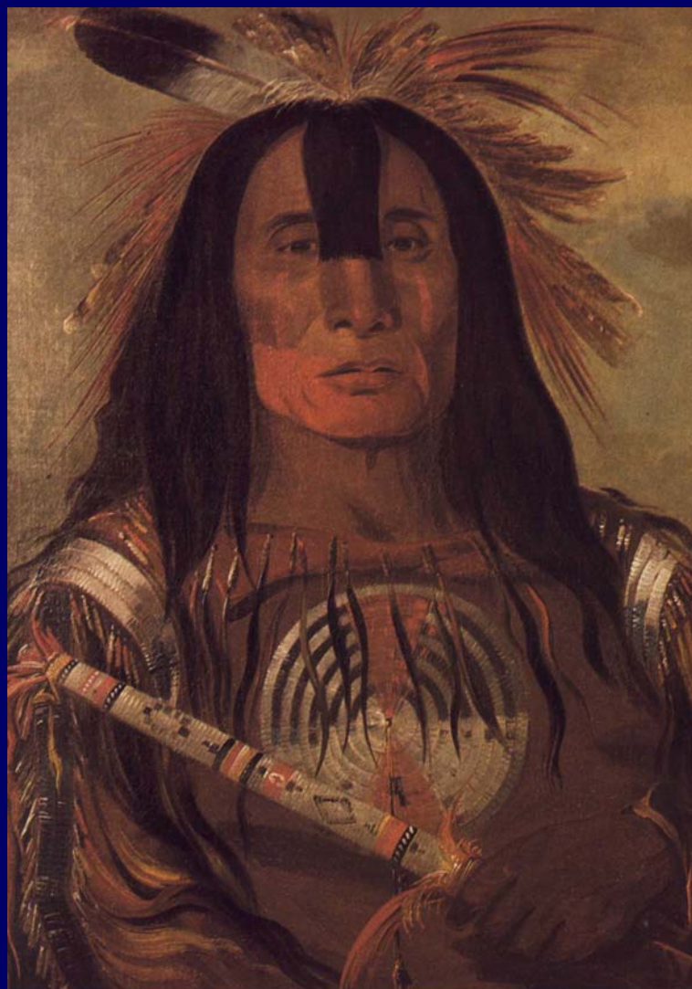
Stu-mick-o-suks Il Grasso della Gobba del Bufalo, capo piedi neri