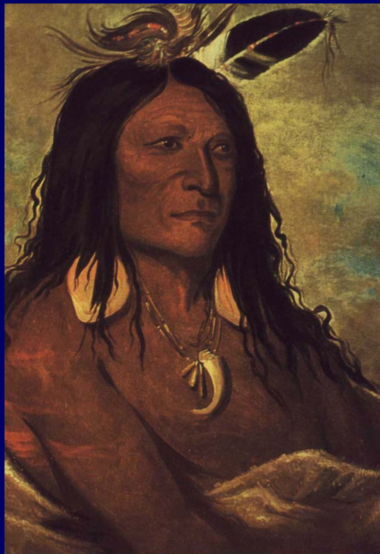
Ee-shah-ko-nee L'Arco e la Faretra, capo comanche