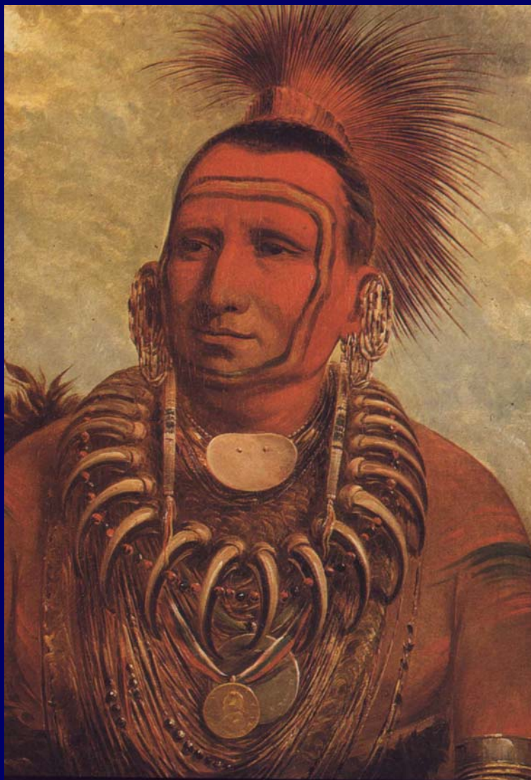
Sharita-rish capo kansas